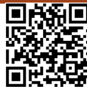
Opći uvjeti poslovanja

Za putovanje vrijede Ugovor i Opći uvjeti poslovanja putničke agencije SILVIJA TURIST koje možete naći na našoj web stranici: www.silvija-turist.hr ili osobno podići u poslovnici. Prihvaćanjem ponude putnik prihvaća i Opće uvjete agencije.