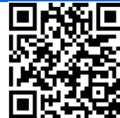
Opći uvjeti poslovanja

Za putovanje vrijede Ugovor i Opći uvjeti poslovanja putničke agencije SILVIJA TURIST koje možete naći na našoj web stranici: www.silvija-turist.hr ili osobno podići u poslovnici. Prihvaćanjem ponude putnik prihvaća i Opće uvjete agencije.